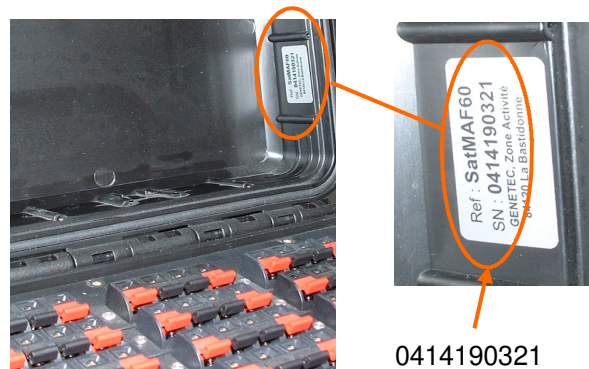
Satellite version « Flight case » (2007 à 2014)